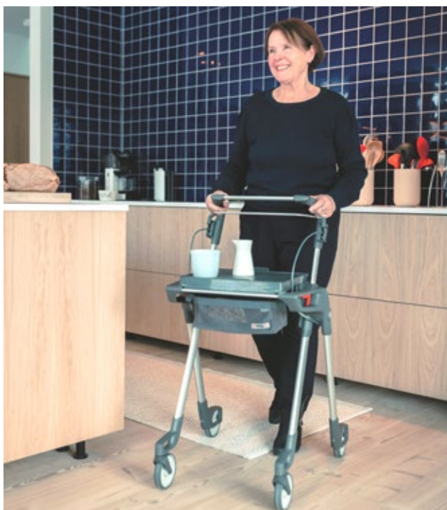
Indoor-Rollator Hestia: das entscheidende Plus an Eigenständigkeit und Komfort zuhause.

Die integrierten, ausziehbaren Aufstehgriffe erlauben ein sicheres Abstützen beim Aufstehen und Hinsetzen. Zum ungehinderten Laufen können die Griffe wieder versenkt werden.