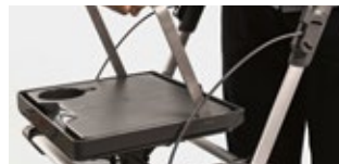
Getränkehalter, Rille für Smartphone/Tablet