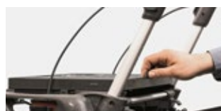
Auch im Sitzen nahe am Tablett