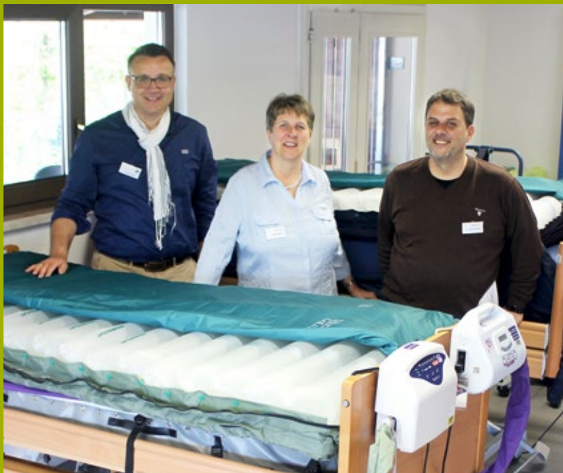
Rund um das Thema Dekubitus. Unter Mitwirkung einer zertifizierten Wundexpertin.

Zwei Jahre lang musste er verschoben werden – nun ist es so weit. Dieses Jahr planen wir einen neuen Naropa-Workshop zum Thema Dekubitus – Prophylaxen, Therapien sowie praktische Anwendung und Vorstellung verschiedener Wechseldrucksysteme.