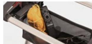
Praktische und diskrete Aufbewahrung von Gegenständen